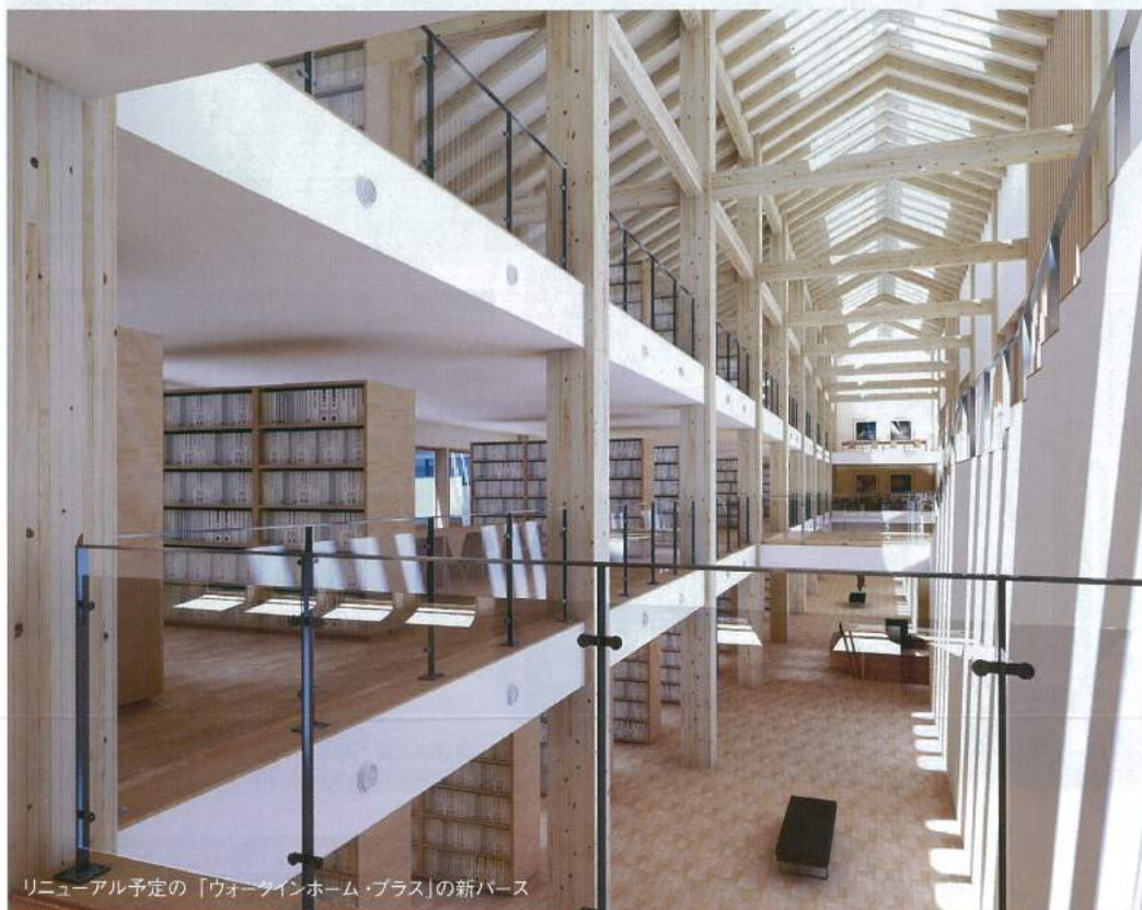
リニューアル予定の「ウォークインホーム・プラス」の新ベース