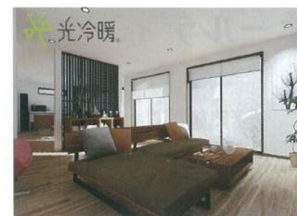
「光冷暖システム」を設置したウォークインホームのベース画像

携、組織再編などで進む自社の変革に対応するため、今夏をめどにホームページの全面リニューアルも検討。「これまでのCAD専門業者のイメージから、お客様の抱えている問題を解決するために、企画、設計、開発、運用などを実行するシステムインテグレーション事業者として発展していきたい」と次世代を見据えた事業展開を進める構えだ。