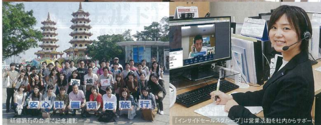
研修旅行の台湾で記念撮影