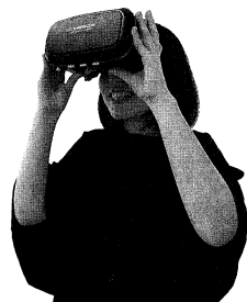
左：ビフォー・アフター 右：ゴーグルのぞき

ウォークスルーやカラーシミュレーション、背景合成などができるもの。360° のパノラマ CG やパノラマ写真を使って内装のビフォー・アフターを現場で体感できるもの。これらは登録ユーザーならアプリも利用料も無料で使い放題なのが特徴だ。